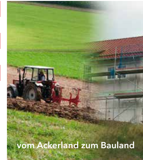
vom Ackerland zum Bauland